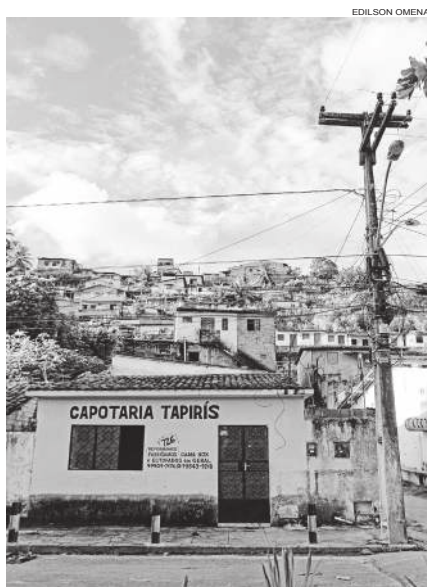
Comunidade busca apoio para dar seqüência na cobrança por realocação

Flexais de Cima e de Baixo, no bairro do Bebedouro, antes das reuniões técnicas serem suspensas pelo Município de Macéio. Assim, a OAB teve a oportunidade de conhecer aspectos jurídicos e técnicos que permeiam o caso, especialmente quanto à inexistência de unanimidade entre os moradores da área. Destaque para a existência de uma comunidade tradicional de pescadores que dependem diretamente da lagoa e o importante questionamento sobre a destinação futura daquela área diante de uma evacuação sem relação com o risco geológico de afundamento em decorrência da exploração de sal-gema", defende o MPF.