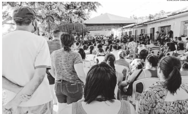
Audiência pública realizada mês passado na comunidade, que busca constituir aliados para garantir realocação

Ainda esta semana, uma nova reunião entre OAB e moradores deve ocorrer