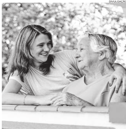
Idosos serão atendidos "com prioridade" pela autoridade policial

apreensão imediata de arma de fogo de quem tem a posse;