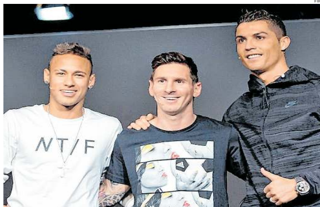
Neymar, Messi e Cristiano Ronaldo podem fazer o ataque dos sonhos no time do PSG

O “FootballTransfers” disse que uma volta para a Juventus ou para o Sporting, clube que ele foi revelado, estão descartadas nesse momento e que o desejo do craque é ir mesmo para o PSG, para formar o “ataque dos sonhos” com Messi e Neymar.