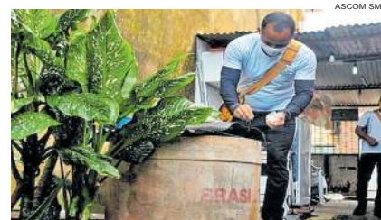
Desde o início do ano foram notificados 134 casos da doença em Maceió

No Brasil, para doar um órgão basta comunicar à família sobre o desejo de ser doador para que a ela possa autorizar posteriormente. Mas a recusa familiar ainda é alta e se torna um dos principais motivos para que um órgão no Brasil não seja doado: mais de 43% das famílias recusaram a doação de órgãos de seus parentes após morte encefálica comprovada, em 2020, segundo dados da Associação Brasileira de Transplante de Órgãos (ABTO).