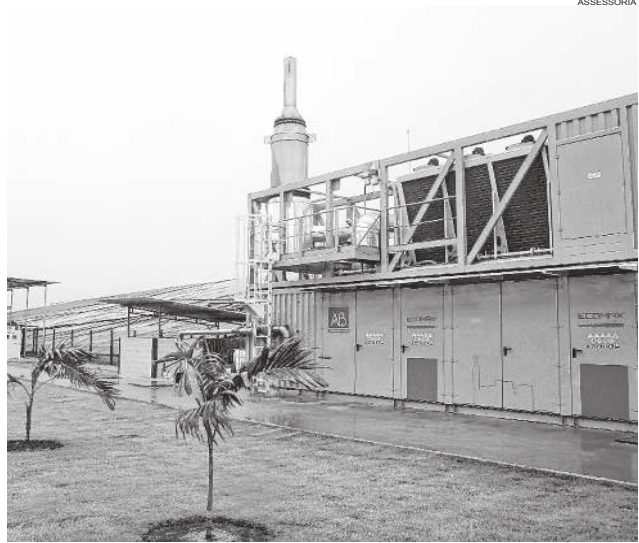
Primeira usina alagoana de energia elétrica oriunda do metano do lixo será inaugurada hoje

A Alagoas Ambiental é pioneira também, no estado, na transformação do chorume pro-