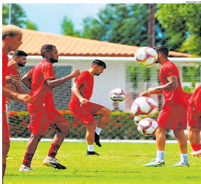
CRB segue treinando forte para as fases finais da Copa do Nordeste e do Campeonato Alagoano

Na primeira fase, Cruzeiro e CRB ficaram no mesmo