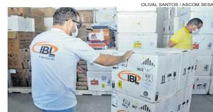
Nova remessa da vacina Pfizer Pediátrica chegou a Alagoas ontem

"Todos os dias, nós estamos nas ruas de Maceió, realizando ações para diminuir a proliferação do vetor de transmissão da dengue, chikungunya e zika. São atividades de orientação à população, rastreamento de locais de risco, tratamento com inseticidas, entre outras. Precisamos, também da colaboração da população para que todos fiquem atentos em suas casas e façam cada um a sua parte e, só dessa forma, poderemos diminuir e até mesmo zerar o número de casos em Maceió", disse.