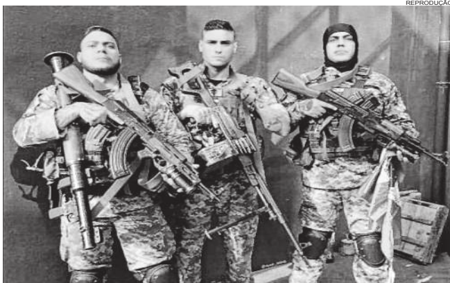
Na caçada por likes nas redes sociais, soldados brasileiros da Ucrânia facilitaram ataques de russos

Soldados brasileiros na Ucrânia estão sendo apontados como responsáveis por ajudar russos a localizar bases inimigas e atacá-las. A estupefação de mostrar fotos e vídeos nas redes sociais estaria servindo para localizar tropas da Legião Internacional de Defesa Territorial.